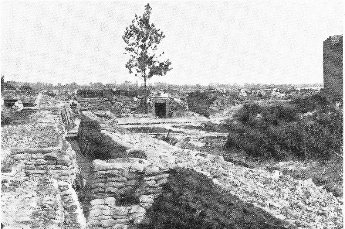
Boyau de communication vers les tranchées de Dixmude

Engagé volontaire, rejoignit l'armée le 25 mars 1915 et remplit ses fonctions avec le plus grand zèle, il fut tué accidentellement, en service, le 6 août 1916, et inhumé au cimetière d'Adinkerke.